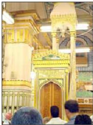
منبر پیامبر ﷺ