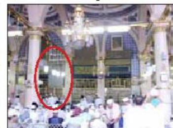
شمال حجره شریفه و محراب تهجد که روی آن را پوشانده اند