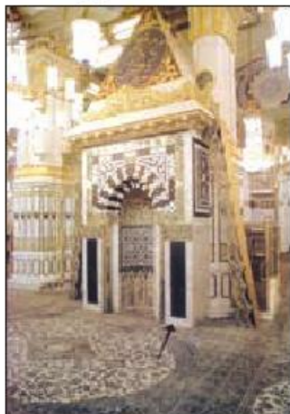
محراب پیامبر ﷺ