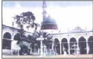
حدیقه الزهرا ﷺ