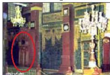
محراب تهجد قدیم قبل از آنکه پوشانده شود