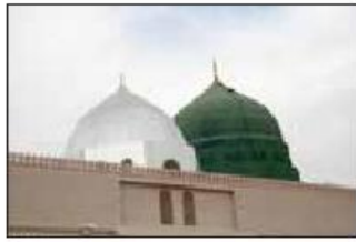
گنبد خضرا و گنبد زرقا