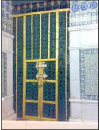
در خانه حضرت زهرا ﷺ قسمت شرقی حجره شریفه