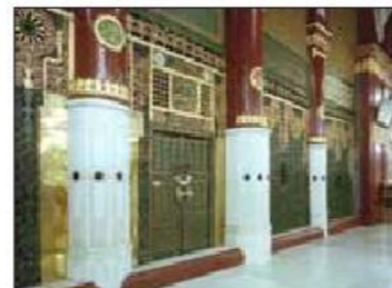
غرب حجره شریفه باب وفود و ستون های وفود، حرس و سریر