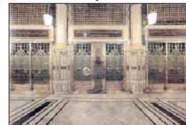
قسمت جنوبی حجره شریفه و باب توبه