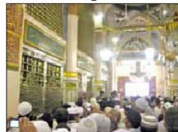
راهروی جنوبی حجره شریفه نزدیک باب بقیع