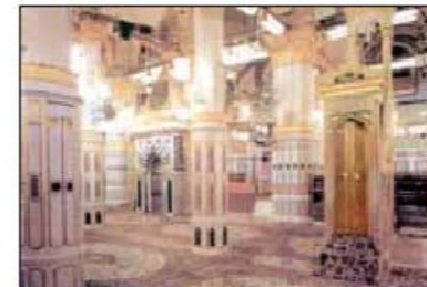
منبر و محراب پیامبر ﷺ